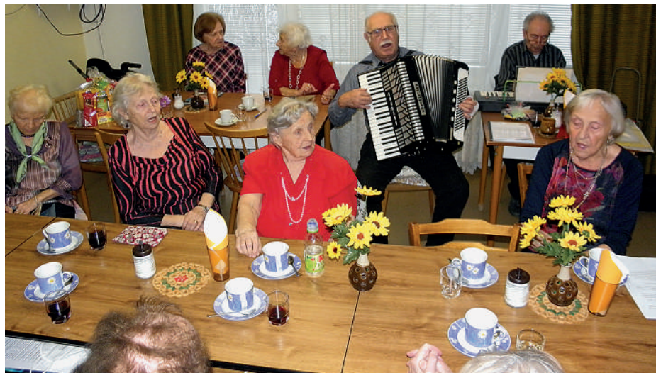
Blahopřání lednovým jubilantům.