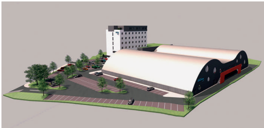
Doprava do rozsáhlého areálu nemůže být řešena přes Vinohrady a nesouhlas rady s projektem tak i z těchto důvodů stále trvá.

Radě byla předložena dokumentace technické studie „Dopravní napojení sportovního centra na ulici Jedovnickou“. Jedná se o studii, která vychází mimo jiné i z požadavků městské části, neboť jsme již v minulosti apelovali na to, aby doprava do připravovaného sportovního centra ledního hokeje mezi ulicemi Čejkovická a Jedovnická nebyla řešena přes ulici Čejkovickou v blízkosti obytné zástavby, ale právě ulicí Jedovnickou. Vliv městské části na projekty