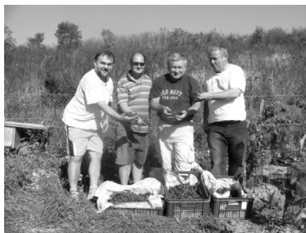
Sběrači nad letošním ukázkou prvních hroznů